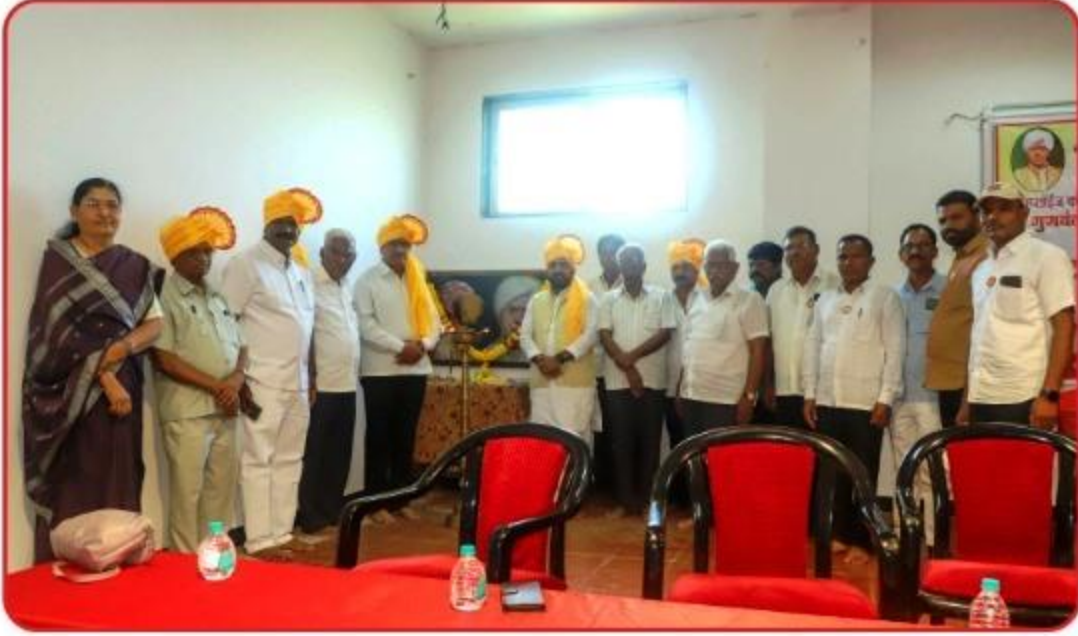
गुणवंत सभासद व गुणवंत पाल्य यांच्या सत्कार समारंभात प्रतिमापुजन करताना संचालक मंडळ व प्रमुख पाहुणे.