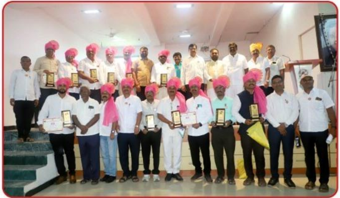
गुणवंत सभासद शिक्षक व मान्यवर.